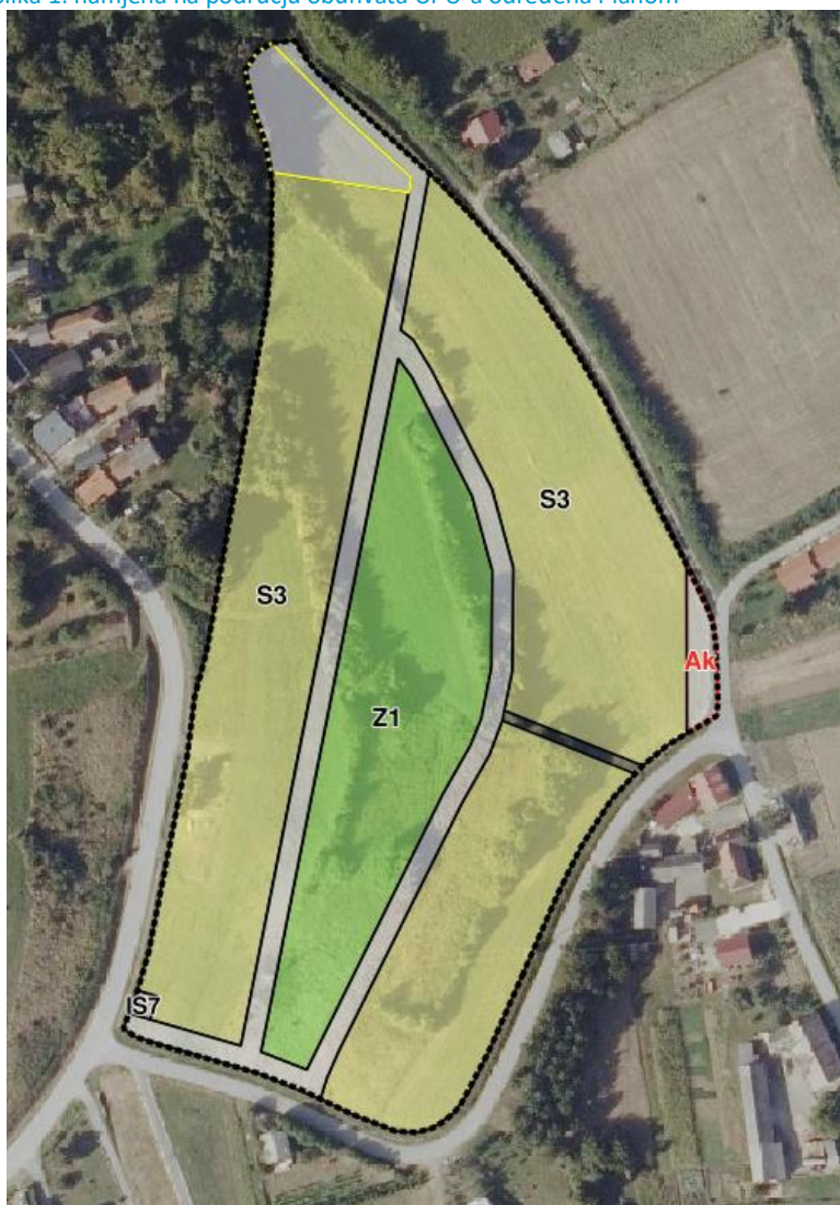
Slika 1: namjena na području obuhvata UPU-a određena Planom